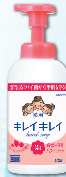
フルーツミックスの香り ポンプ 550mL