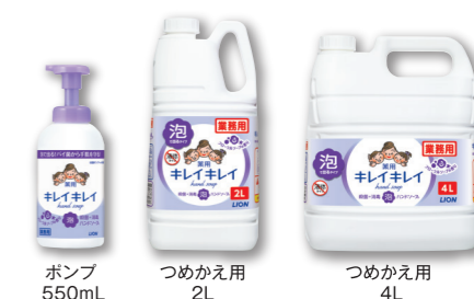
ポンプ 550mL つめかえ用 2L つめかえ用 4L