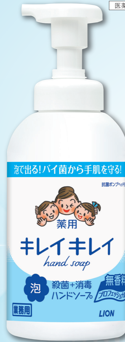
無香料 / ポンプ 550mL