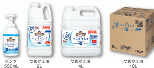
ポンプ 550mL つめかえ用 2L つめかえ用 4L つめかえ用 10L