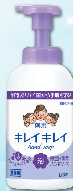
フローラルソープの香り ポンプ 550mL