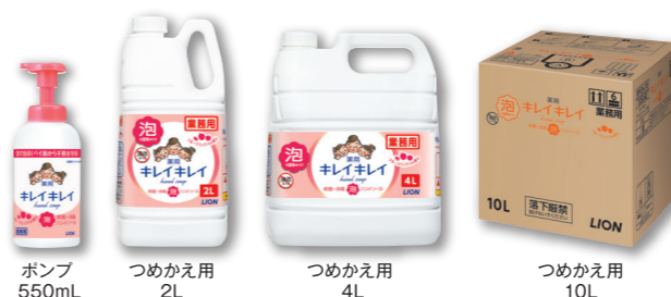
ポンプ 550mL つめかえ用 2L つめかえ用 4L つめかえ用 10L