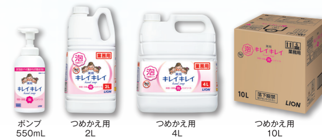
ポンプ 550mL つめかえ用 2L つめかえ用 4L つめかえ用 10L