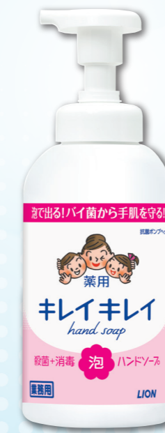
シトラスフルーティの香り ポンプ 550mL