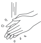
手洗い後の消毒に