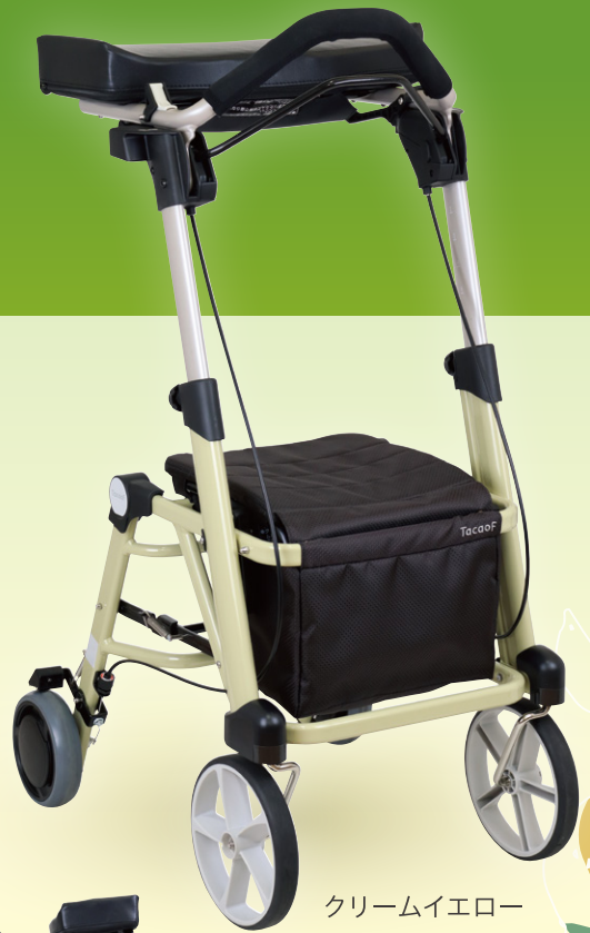
クリームイエロー